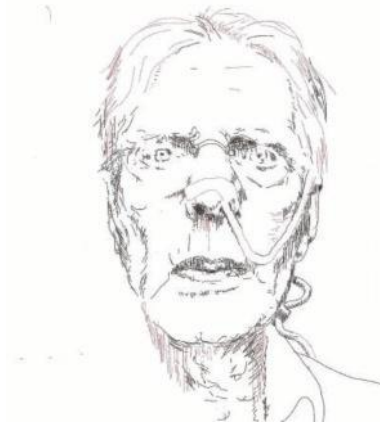
Zelfportret , mei 2017, iPad-tekening.

Steeds weer doken ze op: opgedirkte, pikant geklede vrouwen met gecraqueleerde décolletés en hoofden waarin alles scheef en verkeerd geproportioneerd is. Gordijn werd regelmatig van vrouwenhaat beschuldigd, maar daar was geen sprake van: ook de mannen in zijn werk zijn vaak mooi van lelijkheid. Hij was gewoon niet in de gangbare vorm van schoonheid geïnteresseerd. „Het